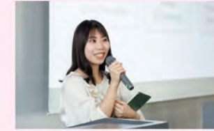
ライフキャリアデザインワーク